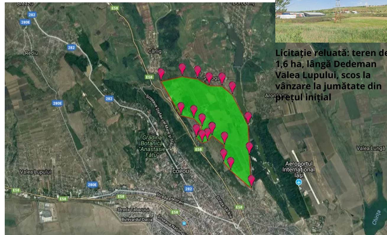
Licitație reluată: teren de 1,6 ha, lângă Dedeman Valea Lupului, scos la vânzare la jumătate din prețul inițial

Suprafața de 420 ha (platoul) care, oficial, nu figurează încă în perimetrul cartierului Moara de Vânt